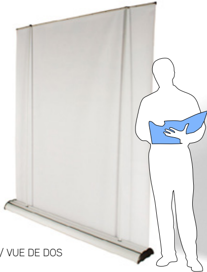
/ VUE DE DOS